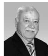
Zdeněk Palán emeritní prezident AIVD ČR

Další články k tématu najdete na www.andromedia.cz v databance dalšího vzdělávání, kterou založila a provozuje Asociace institucí vzdělávání dospělých ČR.