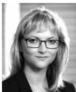
Kateřina Sadílková generální ředitelka Úřadu práce ČR

Změny ve vazbě na procesy průmyslu 4.0 přinesou změny i v poradenské oblasti. A právě cílené kariérové poradenství veřejných služeb zaměstnanosti je jednou z cest, jak může Úřad práce České republiky na jedné straně pomoci zaměstnavatelům zajistit vhodnou pracovní sílu a na straně druhé kvalitní a důstojnou práci pro co nejvíce klientů.